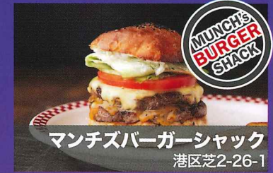
マンチズバーガーシャック 港区芝2-26-1