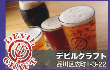
デビルクラフト 品川区広町1-3-22