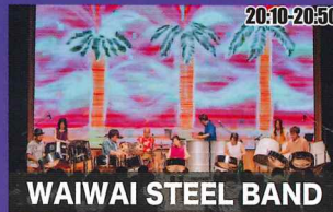
WAIWAI STEEL BAND